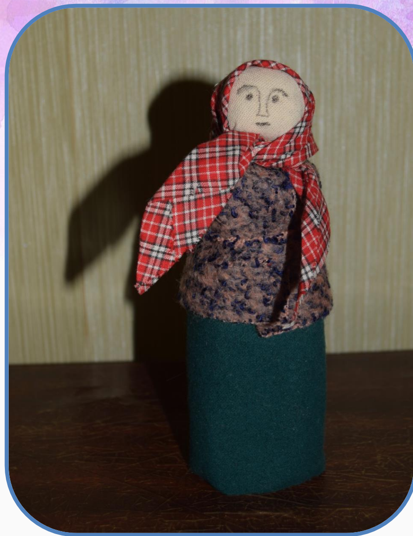
Кукла из деревни Казаково Мышқинского района.