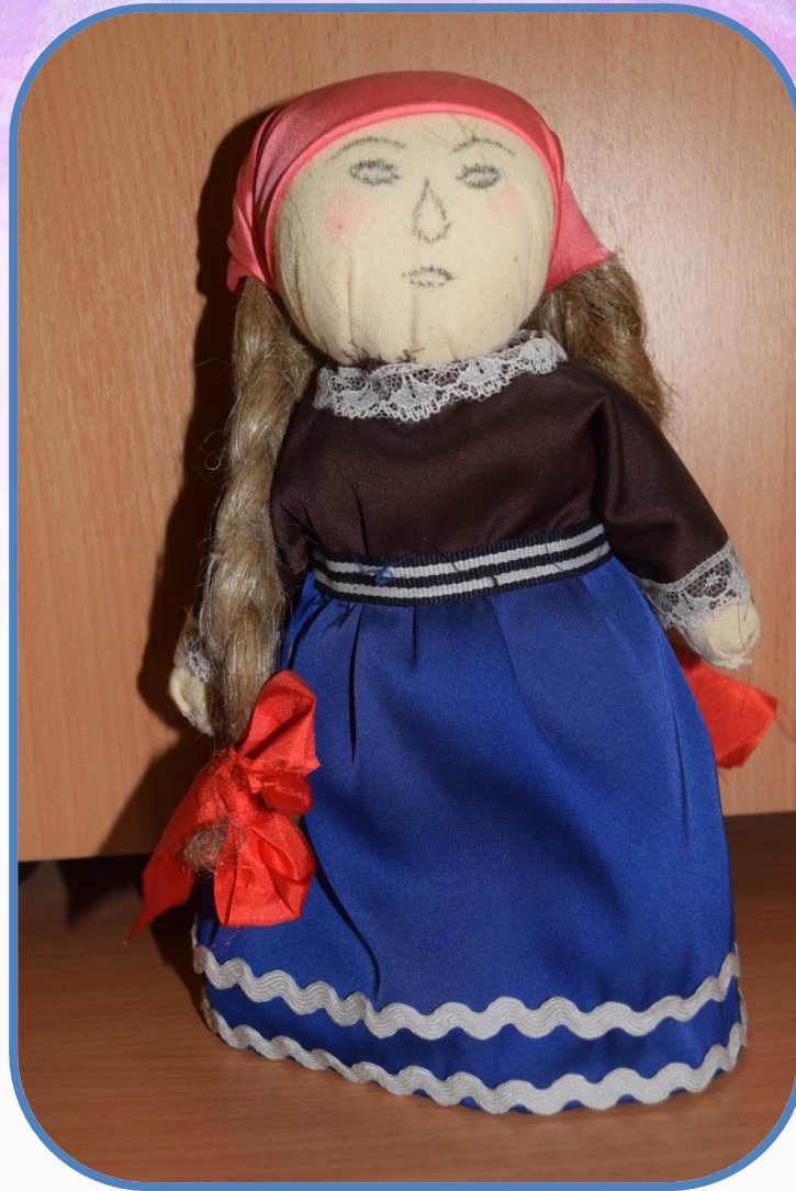
Кукла из деревни Дворково