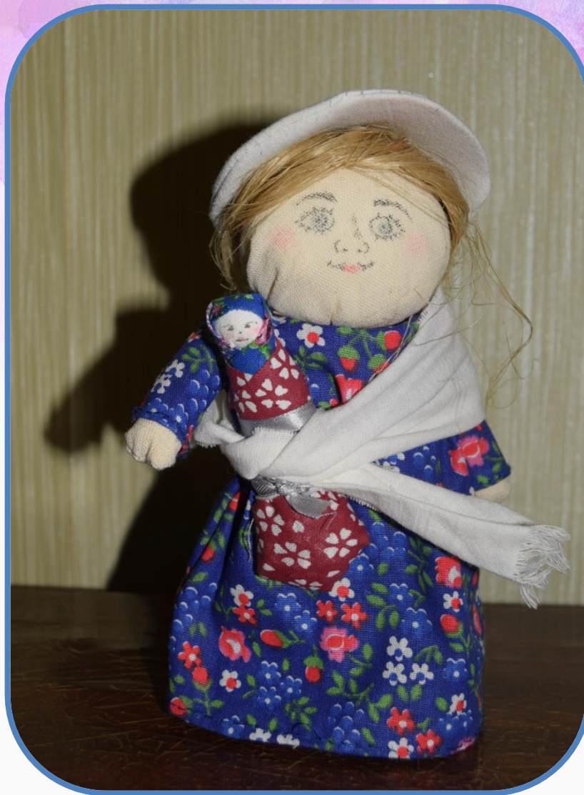
Кукла из Брейтовского района Могогского края.