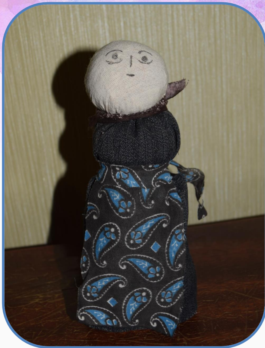
Кукла из Мологи.